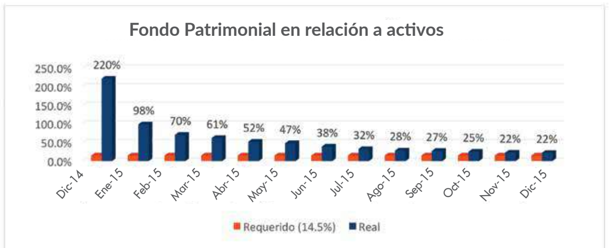
Gráfico 5: Fondo Patrimonial en relación a activos

El gráfico 5 muestra que el comportamiento de la solvencia patrimonial en relación a sus activos en el 2015 ha sido mayor a la requerida legalmente. Con el fondo patrimonial actual la SAC Multivalores puede colocar préstamos por más de US$38 millones.