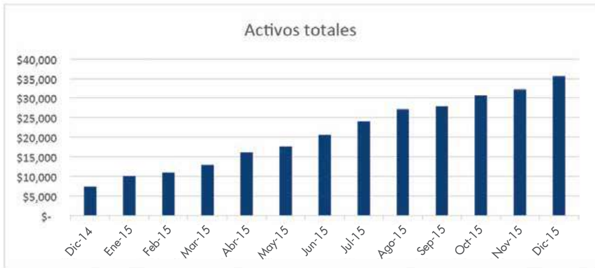
Gráfico 1: Activos totales durante el 2015 (en miles)

El crecimiento en los activos se debió principalmente al crecimiento en la cartera de préstamos, que llegó a US$18.2 millones a diciembre del 2015.