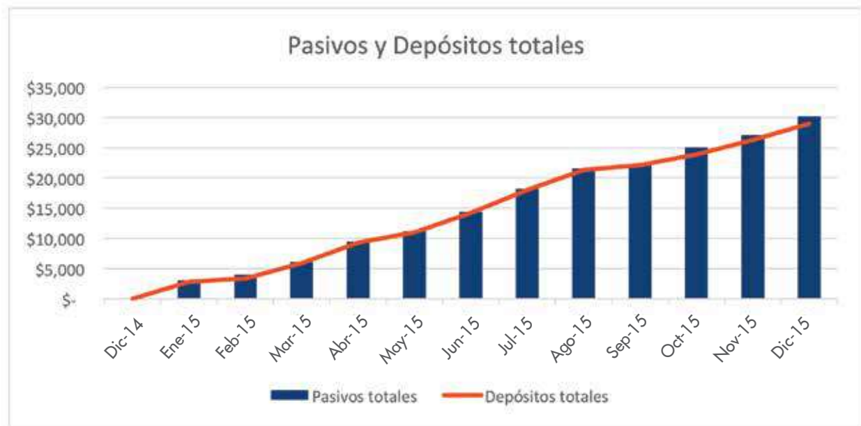
Gráfico 3: Pasivos y depósitos totales en el 2015 (en miles)

Al cierre del 2015, los pasivos totales fueron de US$30.2 millones, presentando un crecimiento de US$30.0 millones respecto al año 2014, de los cuales US$28.9 millones corresponden a depósitos de clientes.