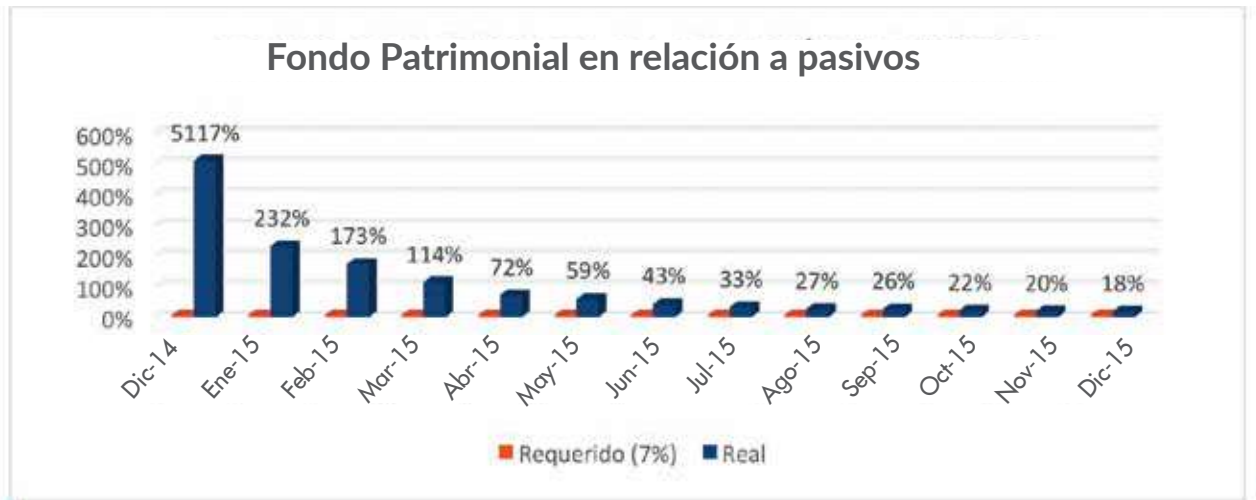
Gráfico 4: Fondo Patrimonial en relación a pasivos

El gráfico 4 muestra el comportamiento de la solvencia patrimonial en relación a sus pasivos en el 2015, la cual ha sido superior al requerimiento legal. Con el fondo patrimonial actual la SAC Multivalores puede captar fondos del público hasta US$79 millones.